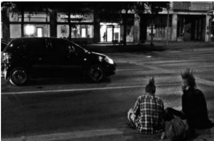
A Bem mozi előtti idill