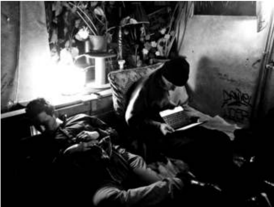
Munkavacsora a Dzsa bárban