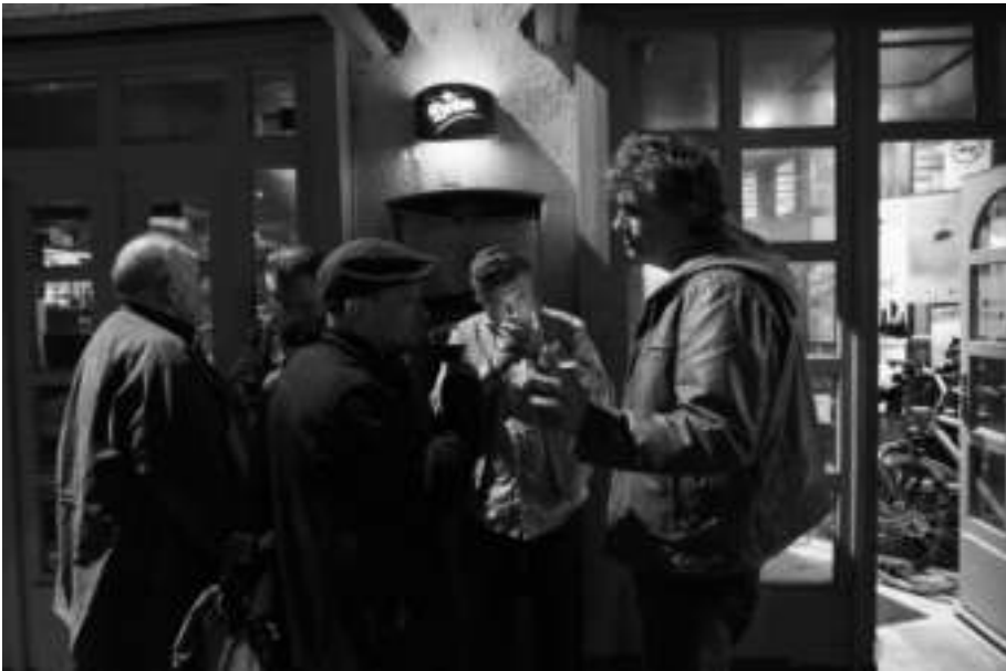
A Libella előtt pár író és színész éjszaka