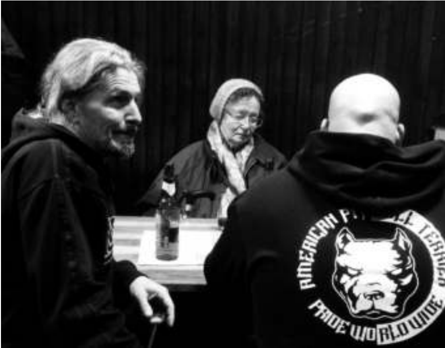
A Fő utcai borozó – sokféleek vagyunk